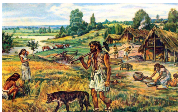
Рисунок № 3.

5. Назовите основные виды деятельности древнего человека.