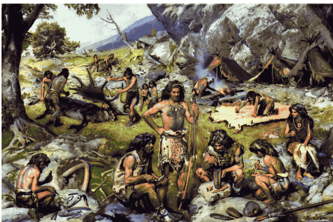
Рисунок № 2.

5. Назовите основные виды деятельности древнего человека.