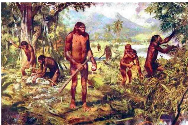
Рисунок № 1.